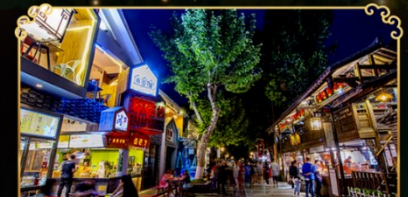
ถนนชอยกวางชอยแคบ