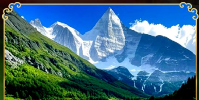
อุทยานกุเวาสีครุณี

กุเวาสีครุณี หนึ่งในสุดยอดธรรมชาติของจีน “จิวจ้ายโกว..สวรรค์บนดินแดนมังกร”