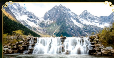
อุทยานปี้เฉิงโกว