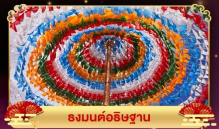
รงมนต์อธิษฐาน