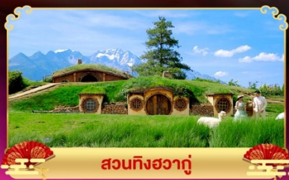
สวนทิงฮวาถู๋

ชมความยิ่งใหญ่อดจากาเวกาโกโปแห่งภูเขาเหมยลี่