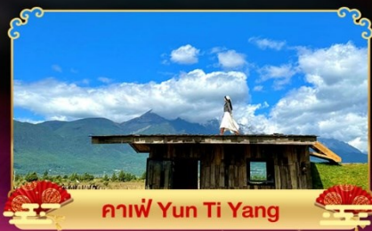
คาเฟ่ Yun Ti Yang