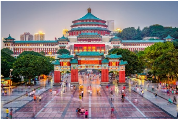
เที่ยวถนนในกรุงปักกิ่ง

นำท่านไป วัดเจ้าแม่กวนอิม (Guanyin Temple, Chongqing) (ระยะทางและเวลาเดินทางขึ้นอยู่กับโรงแรมที่พัก) วัดเจ้าแม่กวนอิมในจงชิ่งเป็นสถานที่ศักดิ์สิทธิ์ที่มีความสำคัญทางพุทธศาสนา และเป็นแหล่งท่องเที่ยวทางวัฒนธรรมที่มีบรรยากาศเงียบสงบ ล้อมรอบด้วยธรรมชาติสวยงามและสถาปัตยกรรมแบบจีนโบราณ จุดเด่นของวัดคือ องค์เจ้าแม่กวนอิม ที่ประดิษฐานอยู่ในวิหารหลัก เป็นองค์ที่งดงามและได้รับการเคารพอย่างสูง นักท่องเที่ยวและผู้มีศรัทธานิยมมาสักการะและขอพรในเรื่องสุขภาพ ความรัก และความสำเร็จ