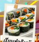
เรียนทำคิมบับ