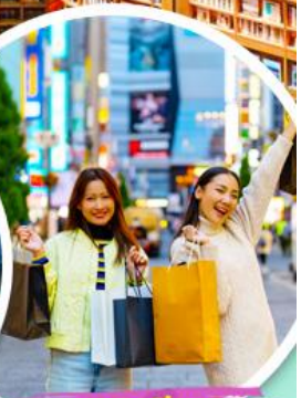
โฮลทาวเวอร์