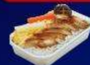
ข้าวเหนียวไก่ย่างเกาหลี