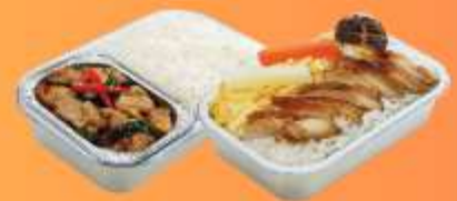
บริการอาหารร้อนบนเครื่อง ชาไป - ชากลับ