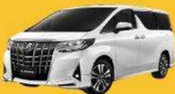
Alphard (2-4 ท่าน)