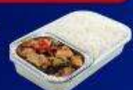
ข้าวกะเพราไก่