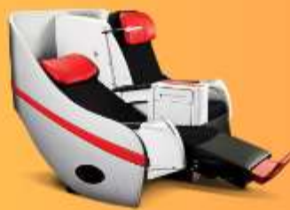
พรีเมียมแฟลตเบด