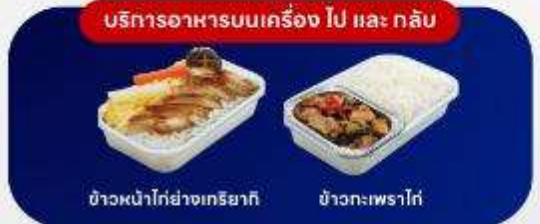
บริการอาหารบนเครื่อง ไป และ กลับ