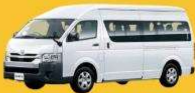
VAN (2-8 ท่าน)