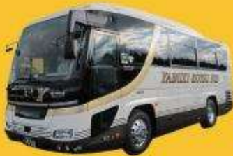
Bus (10-20 ท่าน)

➔ สำหรับท่านที่ต้องการความเป็นส่วนตัวมากขึ้น ท่านสามารถเลือกใช้บริการ รถส่วนตัวได้โดยมีรูปแบบรถให้เลือกถึง 3 ประเภท โดยรถ แต่ละประเภทสามารถนั่งได้ตั้งแต่ 2 ท่านขึ้นไป