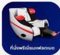
ที่นั่งพรีเมียมแฟลตเบด