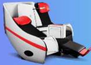
พรีเมียมแฟลตเบด