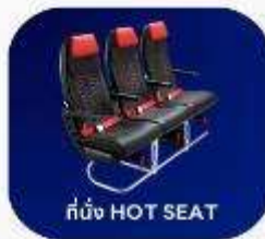
ที่นั่ง HOT SEAT