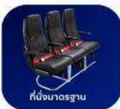
ที่นั่งมาตรฐาน