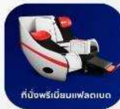
ที่นั่งพรีเมียมเฟลตเบด