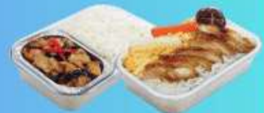
บริการอาหารร้อนบนเครื่อง ขาไป - ขากลับ