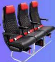
ที่นั่ง HOT SEAT