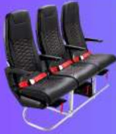
ที่นั่งมาตรฐาน

12.05 น. ออกเดินทางสู่ เมืองโอซาก้า ประเทศญี่ปุ่น โดยสายการบิน THAI AIR ASIA X (XJ) เที่ยวบินที่ XJ610