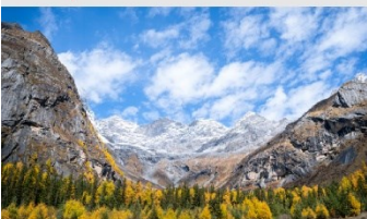
ภูเขาสี่ดรุณี (หุบเขาซวงเฉียวโกว)