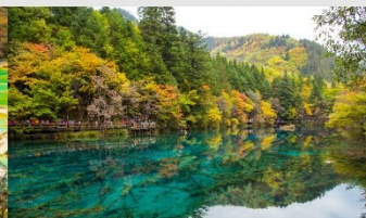
อุทยานแห่งชาติจิ่วจ้ายโกว