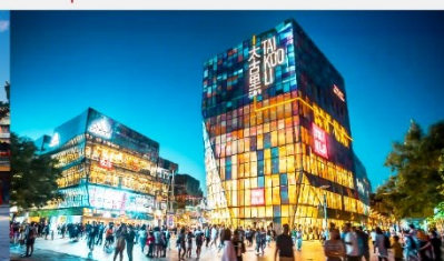
ย่านชุนหลี่ถุน

*ทางบริษัทฯ ขอสงวนสิทธิ์ในการสลับโปรแกรมทัวร์ตามความเหมาะสมขึ้นอยู่กับสถานการณ์หน้างาน โดยคำนึงถึงผลประโยชน์ของลูกค้าเป็นสำคัญ