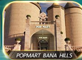
POPMART BANA HILLS

สัมผัสความงามหมู่บ้านฝรั่งเศสที่บานาฮิลล์ ซอปปิง POPMART เยือนเมืองโบราณฮอยอัน ล่องเรือกระดิง วัดหลินอึ้ง สะพานมังกร