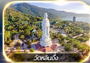
วัดหลนฮ็อง