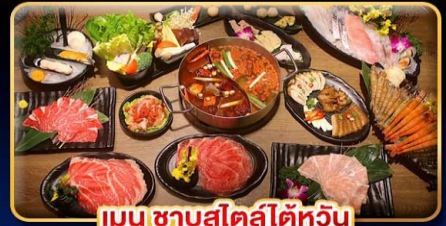
เมนู ชาบูสเตอ์สไต้หวัน