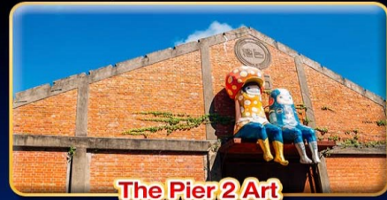
The Pier 2 Art