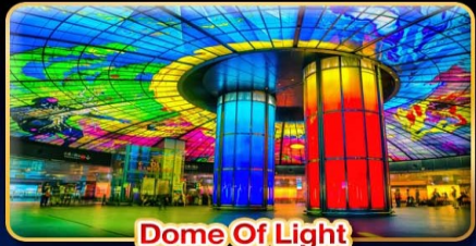
Dome Of Light