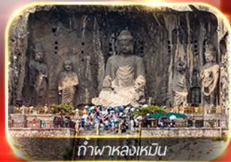
กำแพงหล่งเหมิน