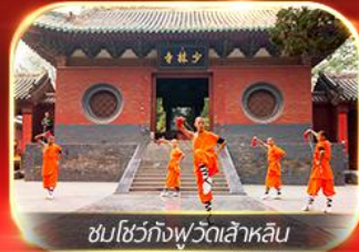
ชมโชว์กังฟูวัดเส้าหลิน