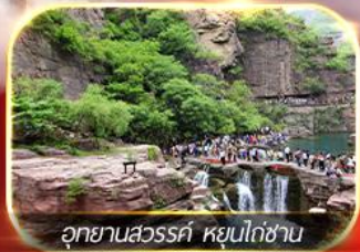
อุทยานสวรรค์ หุ่นโตซาน