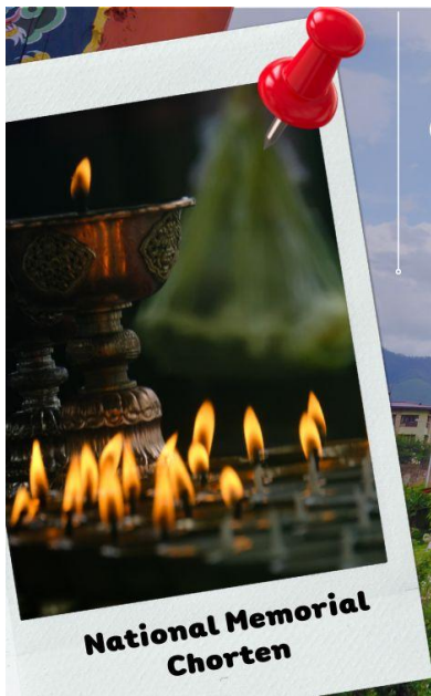
National Memorial Chorten