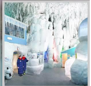
"KAMIKAWA ICE PAVILLION"