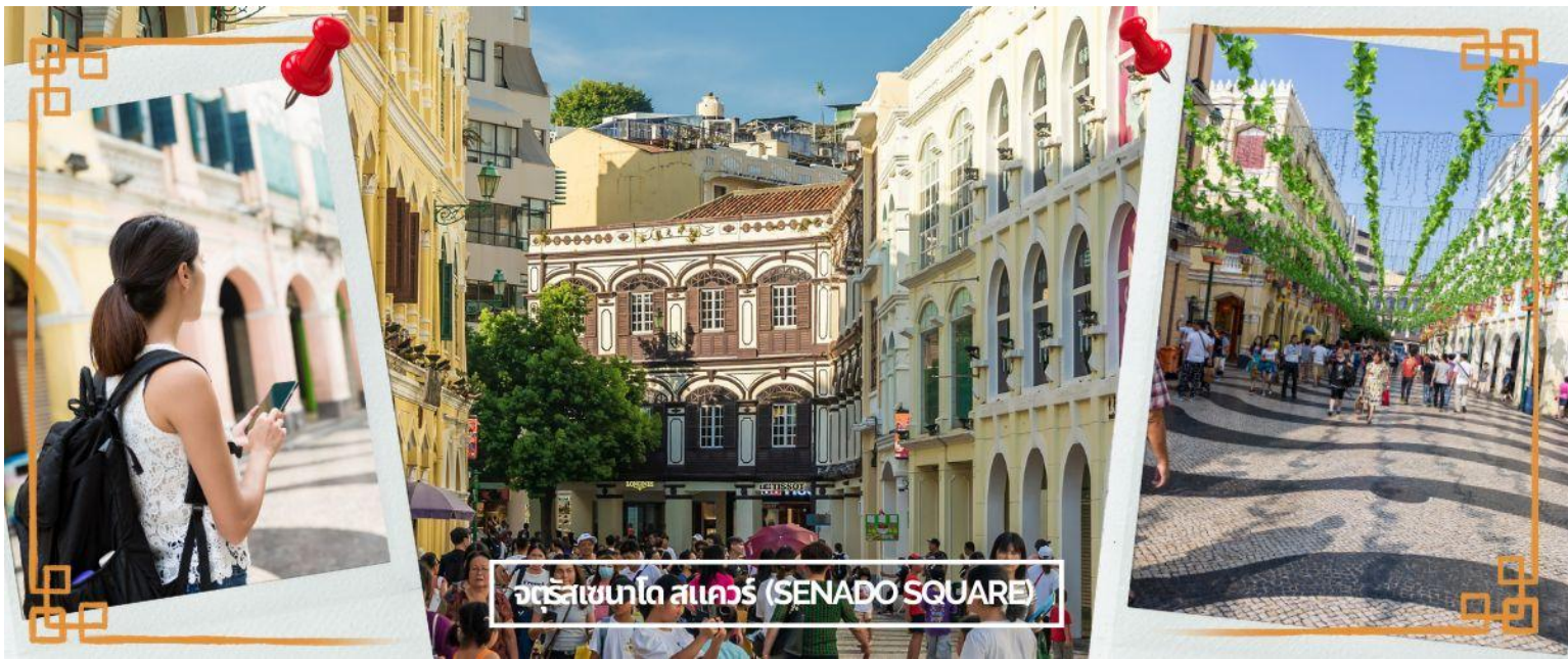
จัตุรัสเซนาโด สแควร์ (SENADO SQUARE)