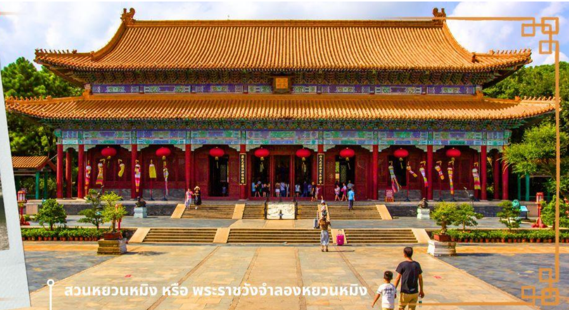
สวนหยวนหมิง หรือ พระราชวังจำลองหยวนหมิง