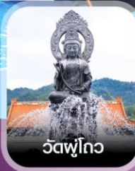
วัดฟูโกว