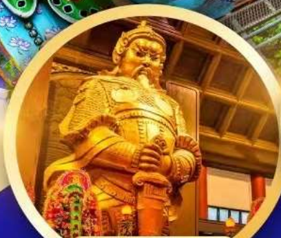
วัดเขangkหมิว ขอพรโชคลาก การเงิน และธุรกิจ