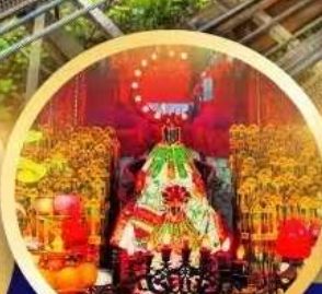
เจ้าแม่กวนอิมฮ่องฮ่า นบิการองค์เจ้าแม่กวนอิมที่มีอายุกว่า 600 ปี