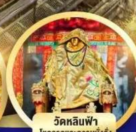
วัดหลินฟ้า โชคลากและความมั่งคั่ง