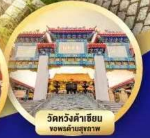
วัดหวงต้าเซียน ขอพรด้านสุขภาพ