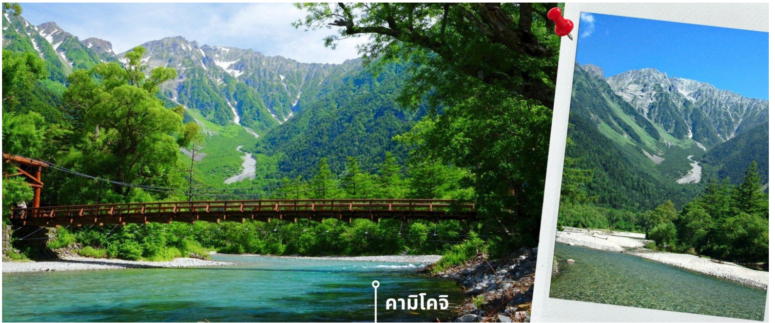
คาบิโคจิ

ก่อนจะสมควรแก่เวลา นำท่านเดินทางช้อปปิ้งที่ อออนมอลล์ Aeon Mall ภายในตัวห้างมีร้านค้าต่างๆมากถึง 150 ร้านซึ่งตกแต่งในรูปแบบที่ทันสมัยสไตล์ญี่ปุ่นสินค้ามากมายหลากหลายให้เลือกตั้งแต่เสื้อผ้าแฟชั่นอาหารสดใหม่และอุปกรณ์ภายในบ้านรวมไปถึงเครื่องสำอางขนมอบญี่ปุ่นต่างๆและยังมีร้านค้ามากมายไม่ว่าจะเป็น Muji, 100 yen shop, Sanrio store, Capcom games arcade และก็ยังมีซูเปอร์มาร์เก็ตขนาดใหญ่ให้เราได้เลือกซื้อของอีกด้วย