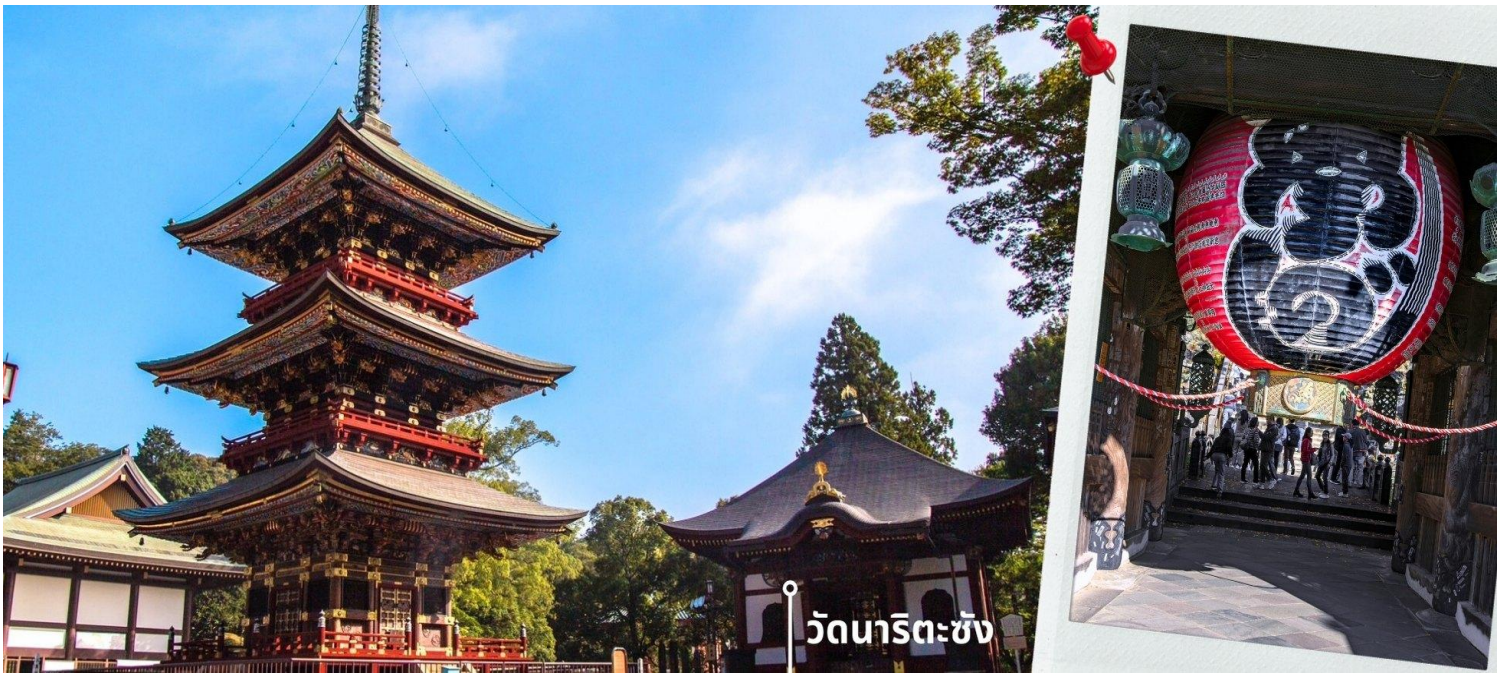
วัดนาริตะซัง

จากนั้นนำท่านเดินทางไปยัง AEON MALL ภายในตัวห้างมีร้านค้าต่างๆมากถึง 150 ร้านซึ่งตกแต่งในรูปแบบที่ทันสมัย สไตล์ญี่ปุ่นสินค้ามากมายหลากหลายให้เลือกตั้งแต่เสื้อผ้าแฟชั่นอาหารสดใหม่และอุปกรณ์ภายในบ้านรวมถึง เครื่องสำอางค์ขนมญี่ปุ่นต่างๆและยังมีร้านค้ามากมายไม่ว่าจะเป็น Muji, 100 yen shop, Sanrio store, Capcom games arcade และก็ยังมีซูเปอร์มาร์เก็ตขนาดใหญ่ให้ท่านได้เลือกซื้อของ