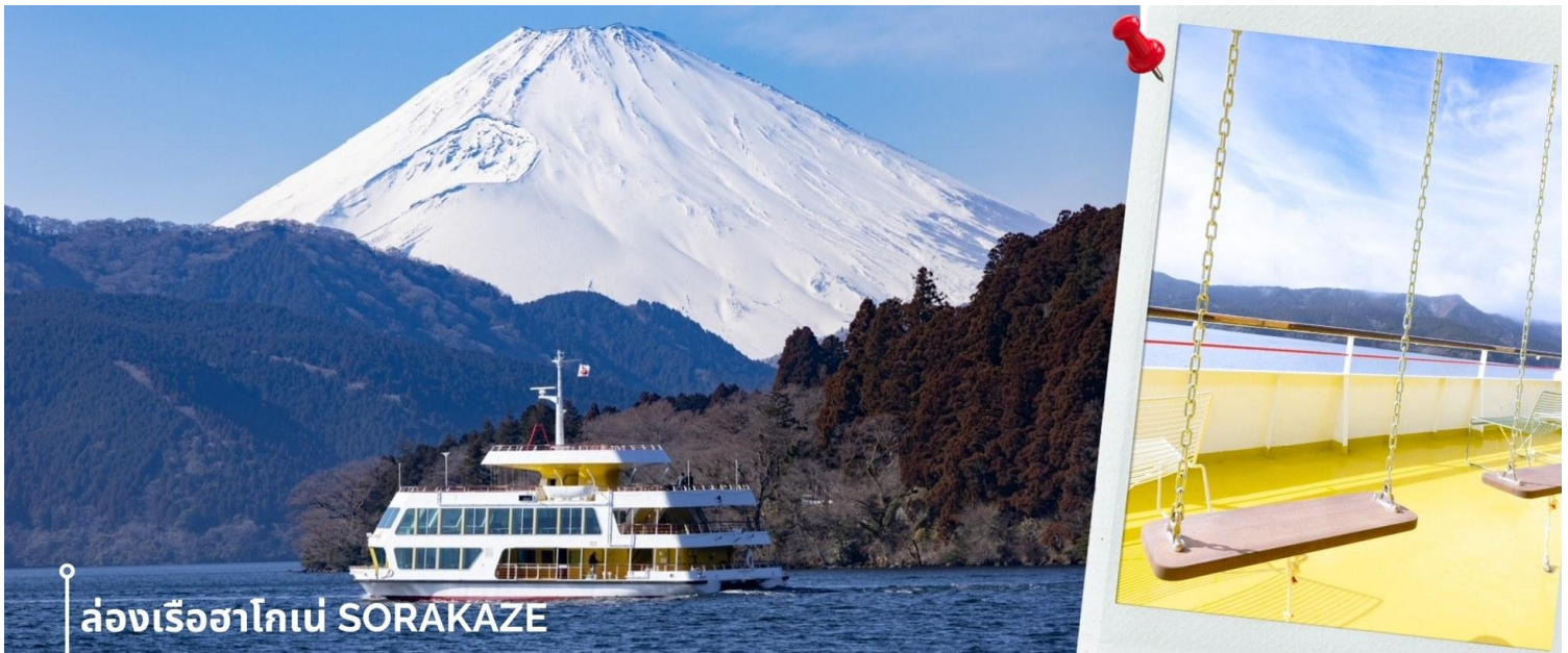
ล่องเรือฮาโกเน่ SORAKAZE

หลังรับประทานอาหารเที่ยง พาท่านเดินทางสู่ ทะเลสาบอาชิ ซึ่งเป็นทะเลสาบที่ล้อมรอบไปด้วยธรรมชาติที่อุดม สมบูรณ์และวิวกุเขาฟูจิ เป็นหนึ่งในทะเลสาบที่สวยงามที่สุดในญี่ปุ่น ในประวัติศาสตร์เชื่อกันว่าทะเลสาบแห่งนี้เกิดขึ้นจาก การปะทุของภูเขาไฟเมื่อประมาณ 3100 ปีก่อน ปัจจุบันเป็นแหล่งท่องเที่ยวในฮาโกเน่ พาท่าน ล่องเรือฮาโกเน่ SORAKAZE โดยเรือลำนี้ได้มีการรีโนเวทใหม่ในชื่อ Hakone Maru และมีการปรับปรุงลักษณะเรือลำใหม่ โดยออกแบบ เรือให้มีความเป็นมิตรต่อสิ่งแวดล้อมและเข้ากันกับทิวทัศน์ที่สวยงามของภูเขาไฟฟูจิ รวมถึงใช้เชือกมงคล Mizuhiki ดัด เป็นรูปร่างนกกระเรียน ซึ่งเป็นอัตลักษณ์สำคัญที่สะท้อนถึงความเป็นญี่ปุ่น ภายในห้องโดยสารชั้น 2 ถูกออกแบบมาให้ สามารถชมบรรยากาศภายนอกได้อย่างชัดเจนด้วยกระจกบานใหญ่ ชั้นบนถูกแต่งให้เหมือนสวนสาธารณะ ทั้งกระถาง ต้นไม้ ม้านั่ง ชิงช้า ให้ท่านได้ชมวิวกุทิวทัศน์และธรรมชาติรอบๆทะเลสาบ และในวันที่ฟ้าเปิดยังสามารถมองเห็นฟูจิซึ่ง จากตรงนี้ได้อีกด้วย โดยจะล่องจากท่าเรือ HAKONE SEKISHO - ท่าเรือ MOTOHAKONE ก่อนจะพาท่านขึ้นฝั่ง