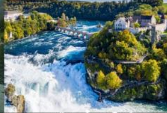
เขื่อนน้ำตกโรน