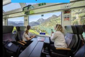
รถไฟ Panorama วิวดูวิว