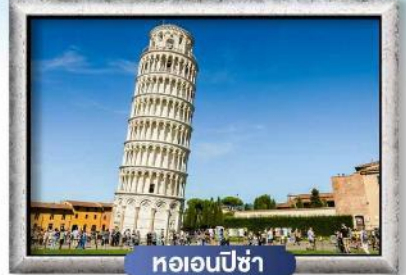
หออนปีซ่า

ชมเมืองมรดกโลกแห่งแคว้นอาลซัส เมืองสตราสบูร์ก