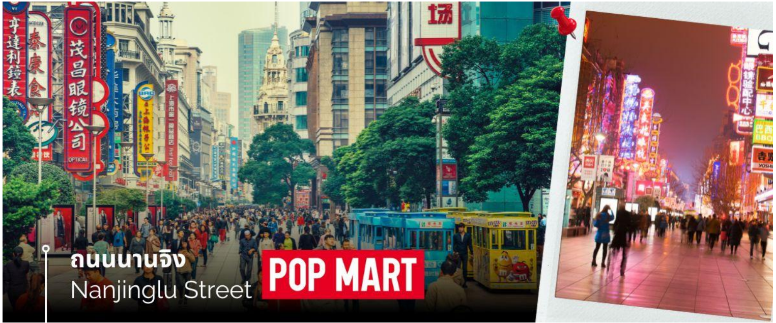
ถนนนานจิง Nanjinglu Street

จากนั้นนำท่านสู่บริเวณ หาดไ่ว่ทาน ตั้งอยู่บนฝั่งตะวันตกของแม่น้ำหวงผู้มีความยาวจากเหนือจรดใต้ถึง 4 กิโลเมตร เป็นเขตสถาปัตยกรรมที่ได้ชื่อว่า “พิพิธภัณฑ์สิ่งก่อสร้างหมื่นปีแห่งชาติจีน” ถือเป็นสัญลักษณ์ที่โดดเด่นของนครเซี่ยงไฮ้ให้ท่านได้ชมวิวดูหาดไ่ว่ทานในยามเย็นและนำท่านช้อปปิ้งย่าน ถนนนานจิง Nanjinglu Street ศูนย์กลางสำหรับการช้อปปิ้งที่คึกคักมากที่สุดของนครเซี่ยงไฮ้ รวมทั้งห้างสรรพสินค้าใหญ่ชื่อดังกว่า 10 แห่ง และช้อปปิ้ง ร้าน POP MART สุดฮิตในขณะนี้เพื่อเป็นของฝากที่ระลึก