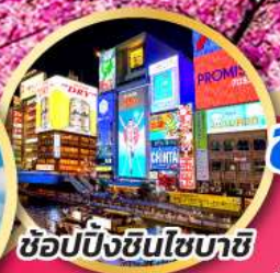
ช้อปปิ้งชินไซบาชิ