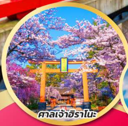
ศาลเจ้าอิราโนะ