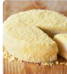
ร้าน LeTAO ร้านนี้ผลิตเค้กแสนอร่อย อีกรอบมาจาก ร้านกาแฟชื่อดังไปที่สามง่าม อิงกลุ่ม ด้วยผลงานจากถนนโอตารุ