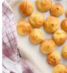
ร้าน KITAKARO ซึ่งมีขนมแบบอบจากเตาตุงๆ 100 กว่า ให้ชิมของขึ้นชื่อจนคนเลยก็ชิม และเหมาะที่จะซื้อของฝากเป็นอย่างดี