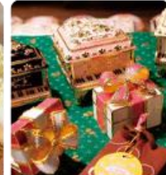
กล่องดนตรี MUSIC BOX