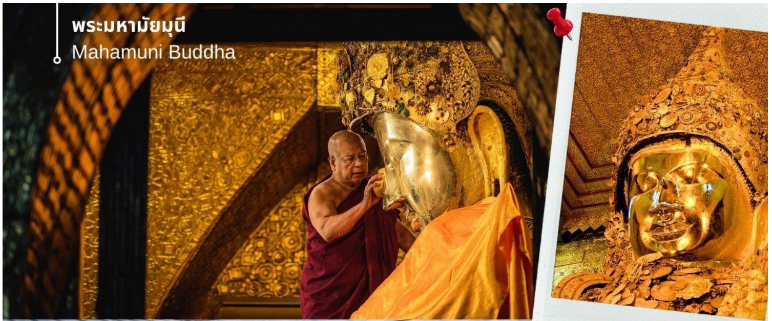
พระมหามัญมุนี Mahamuni Buddha

พระพุทธเจ้า ก่อนใช้ผ้าจากศรัทธาสาธุชนที่ถวายมาเช็ดจนแห้งสนิท แล้วนำกลับคืนแก่สาธุชนผู้นั้นไปบูชาต่อ พร้อมใช้พัดทองโบกถวายเป็นอันดี เสมือนหนึ่งได้อุปฐากองค์สมเด็จพระสัมมาสัมพุทธเจ้าที่ยังทรงพระชนมชีพอยู่ พระมหามัญนี่มีอีกพระนามหนึ่งว่า "พระเนื้อนุ่ม" ซึ่งเกิดจากการปิดทองซ้ำแล้วซ้ำอีกจนเป็นรอยย่นตะปุ่มตะป่ำไปทั่วทั้งองค์ ซึ่งหากเอานิ้วกดลงไปจะรู้สึกได้ถึงความอ่อนนุ่มของทองคำเปลวที่ปิดทับซ้อนกันนับเป็นพัน ๆ หมื่น ๆ ชั้น สมควรแก่เวลานำท่านเดินทางกลับเข้าสู่ที่พัก