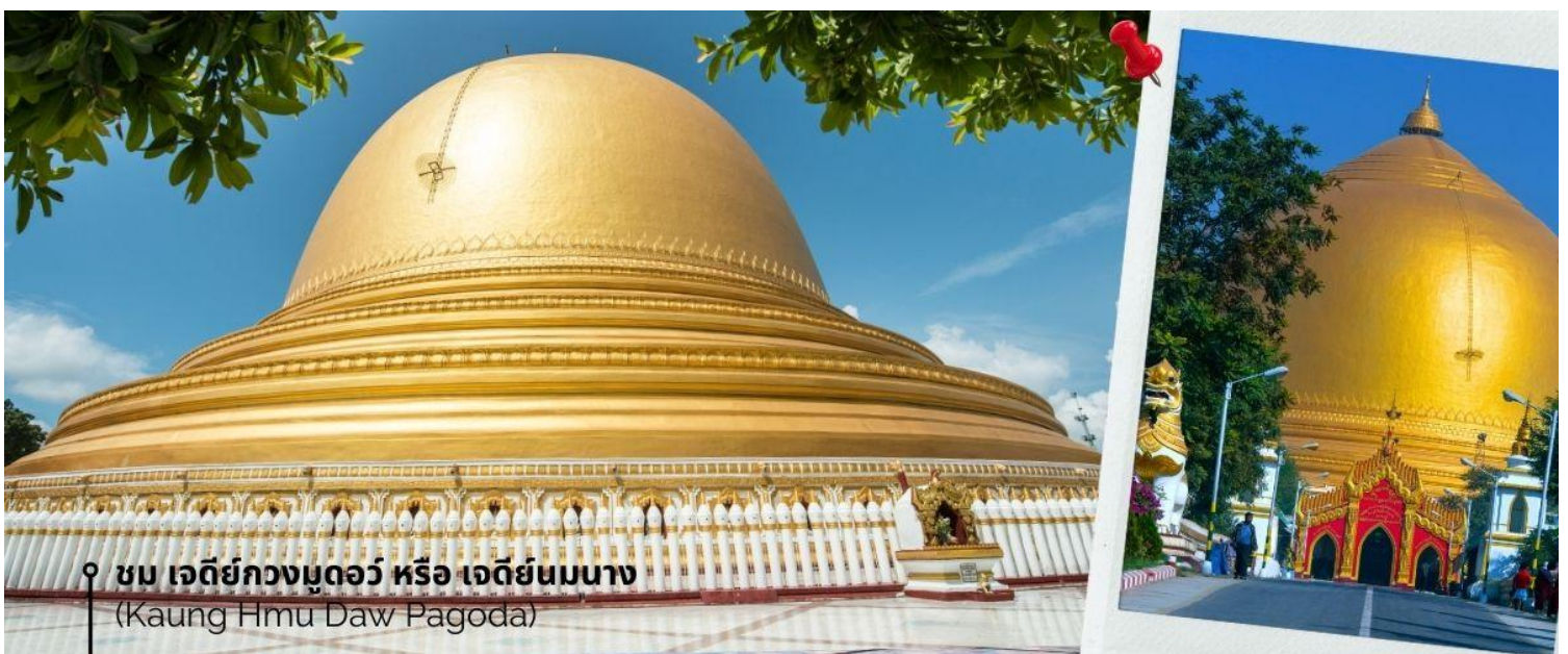
ชม เจดีย์กวงมุดอว์ หรือ เจดีย์นมนาง (Kaung Hmu Daw Pagoda)

นำท่านชม เจดีย์กวงมุดอว์ หรือ เจดีย์นมนาง (Kaung Hmu Daw Pagoda) เป็นเจดีย์พุทธขนาดใหญ่ ตั้งอยู่เขตชานเมืองทางตะวันตกเฉียงเหนือของชะโก้ง โดยจำลองตามสวัณณมาลีมหาเจดีย์ ในประเทศศรีลังกา ฐานชั้นล่างสุดของเจดีย์ประดับด้วยพระและเทวดา 120 องค์ ล้อมรอบด้วยโคมหิน 802 ต้น ซึ่งแกะสลักพร้อมจารึกพุทธประวัติสามภาษาได้แก่ พม่า, มอญ และไทใหญ่ เป็นตัวแทนของสามภูมิภาคหลักสมัยอาณาจักรตองอูยุคฟื้นฟู โดมของเจดีย์ได้รับการทาสีขาวอย่างต่อเนื่อง เพื่อแสดงถึง