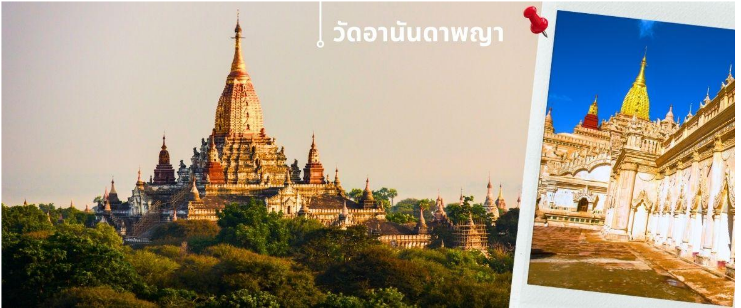
วัดอานันดาพญา

จากนั้นนำท่านนมัสการ วัดอานันดาพญา คือมหาวิหารขนาดใหญ่ที่ตั้งอยู่ในเมืองพุกาม ประเทศพม่า เริ่มสร้างขึ้นใน พ.ศ. 1633 แล้วเสร็จในปีต่อมา ในรัชกาลพระเจ้าจันชิต้า มีความสำคัญในฐานะได้รับการยกย่องว่าเป็น “เพชรน้ำเอกของพุทธศิลป์สกุลช่างพุกาม” ในอดีตยอดพระเจดีย์ยังเป็นสีขาวเหมือนกับพระเจดีย์องค์อื่นๆ ของพุกาม แต่รัฐบาลพม่าได้มาทาสีทองทับเมื่อ พ.ศ. 2533 เพื่อสมโภชการสร้างวัดอานันดาพญา ครบรอบ 900 ปี อานันดาพญา เป็นพระเจดีย์ที่สามารถเดินเข้าไปข้างในได้ แผนผังเป็นรูปสี่เหลี่ยมจัตุรัสมีมุขยื่น 4 ทิศ ประตูทางเข้าเป็นประตูโค้ง ที่มีกพบเห็นในสถาปัตยกรรมตะวันตกมากกว่า ตะวันออก ภายในประดิษฐานพระพุทธรูปประทับยืนไม้ปิดทอง สีทึบ สูง 9.5 เมตร