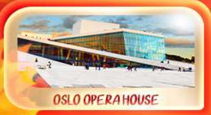
OSLO OPERA HOUSE