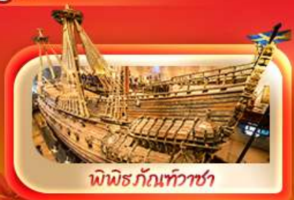
พิพิธภัณฑ์ท้าวชา