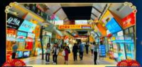
ถนนจินเจีย