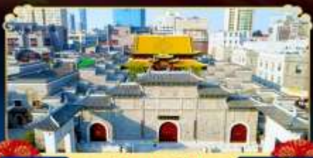
ถนนโบราณวังโซ่กวง

เยือนหมู่บ้านริมผา “หมู่บ้านเทวดาว่างเซี่ยนกู่”