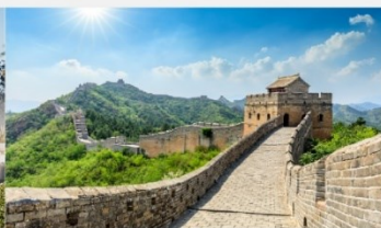
กำแพงเมืองจีน