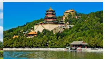
พระราชวังฤดูร้อน

*ทางบริษัทฯ ขอสงวนสิทธิ์ในการสลับโปรแกรมทัวร์ตามความเหมาะสมขึ้นอยู่กับสถานการณ์หน้างาน โดยคำนึงถึงผลประโยชน์ของลูกค้าเป็นสำคัญ