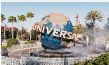
สวนสนุกยูนิเวอร์แซลปักกิ่งสตูดิโอ