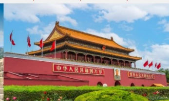
จัตุรัสเทียนอันเหมิน