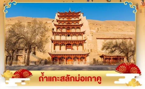
กำแพงสลักม่อเถา

เดินทางโดย : สายการบินโซนาอิสรินแอร์ไลน์ & เซี่ยงไฮ้แอร์ไลน์