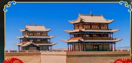
กำแพงเมืองจีนเจียวอวี่กวน