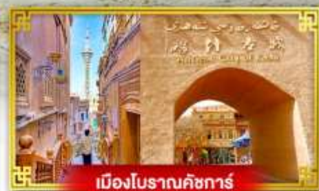
เมืองโบราณคัชการ

เดินทางโดย : สายการบินโซนาเซาเทิร์นแอร์ไลน์