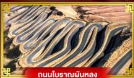
ถนนโบราณผืนหลง

“คัซการ” เกี่ยวสุดขอบตะวันตกประเทศจีน เมืองเก่าแห่งยุคเส้นทางสายไหมโบราณ