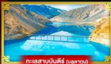
ทะเลสาบบินตี้ร์ (มูลาทุบ)