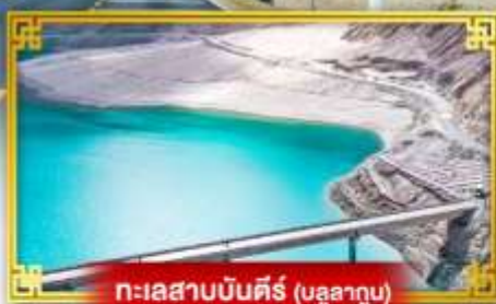
ทะเลสาบบันตีร์ (บลูสาทูน)