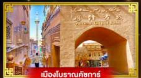
เมืองโบราณคัชการ