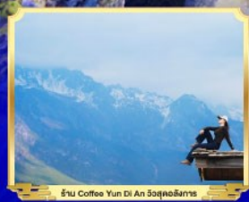
ร้าน Coffee Yun Di An 3000ฟุต