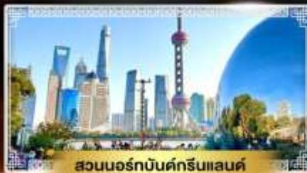
สวนนอร์คบันด์กรีนแลนด์