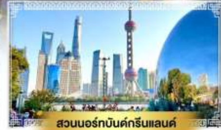
สวนนอร์ธบิ้นด์กรีนแลนด์