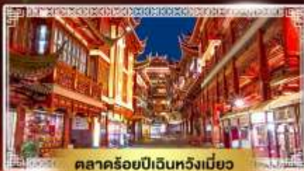
ตลาดร้อยปีเดินห้างเมี่ยว

📅 เดินทาง : 10-15 เม.ย. | 12-17 เม.ย. 68