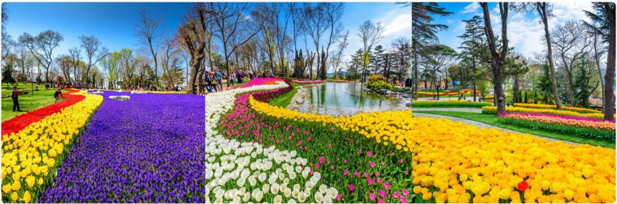
*ภาพเพื่อการโฆษณาเท่านั้น

สวนดอกทิวลิปหลากสีหลายสายพันธุ์นับล้านดอกที่สวยงามที่สุด และมีชื่อเสียงที่สุดของตุรกี ตลอดเดือนเมษายน เทศกาลทิวลิปอิสตันบูล เป็นเทศกาลประจำปี โดยจะจัดในช่วง 3 สัปดาห์สุดท้ายของเดือนเมษายน เพื่อเฉลิมฉลองทั้งฤดูใบไม้ผลิ และความสำคัญของดอกทิวลิป ที่มีต่ออาณาจักรออตโตมัน และวัฒนธรรมตุรกี ปกติแล้วเทศกาลนี้จัดขึ้นที่สวนสาธารณะ ที่มีชื่อเสียงที่สุดของเมือง ให้ทุกท่านได้ถ่ายรูปตามอัธยาศัย