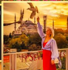
ลูปทีโอปเซเวนฮิลส์