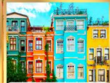
บ้านหลากสี คัลเลอร์ฟูล