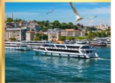
เรือเฟอร์รี่

เที่ยวครบเส้นทางยอดนิยม บินเข้าถึงเย็น เข้าชมสุเหร่ายักษ์คามลิก้า และล่องเรือเฟอร์รี่ ชมเทศกาลทิวลิปแห่งนครอิสตันบูล