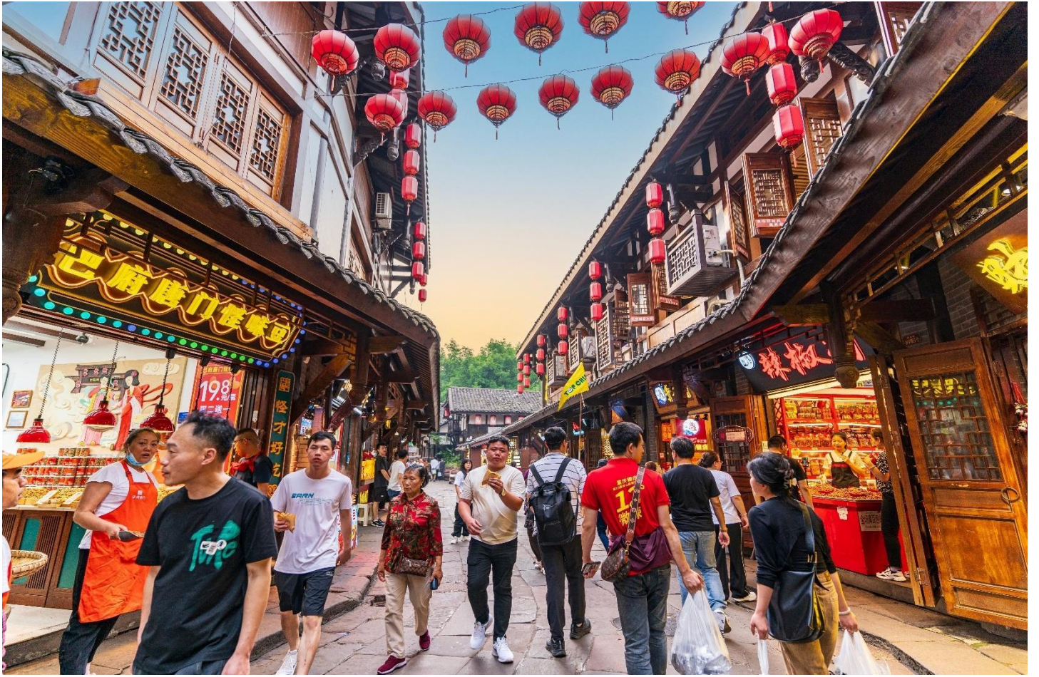
เที่ยง รับประทานอาหารเที่ยง ณ ร้านอาหาร