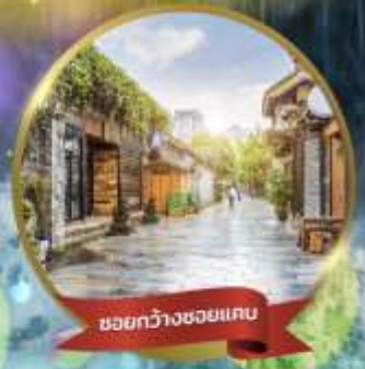
ชอยกว้างชอยแคบ