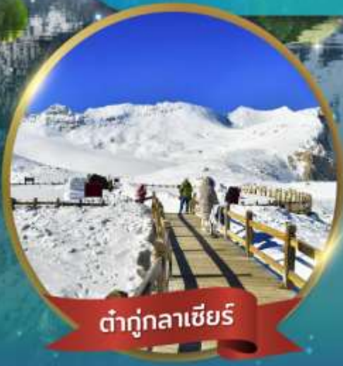
ต่าตุ๊กลาเซียร์