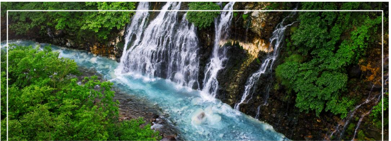
SHIRAHIGE WATERFALL น้ำตกชิราฮิเกะ

วันที่สอง ทำอากาศยานนิวซีโดเสะ สอกโกโด – เมืองบิเอะ – น้ำตกชิราฮิเกะ – สระอะโออิเคะ หรือ บ่อน้ำสีฟ้า – เมืองอาซาฮิคาว่า – อีออน อาซาฮิคาว่า