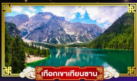
เทือกเขาเทียนชาน