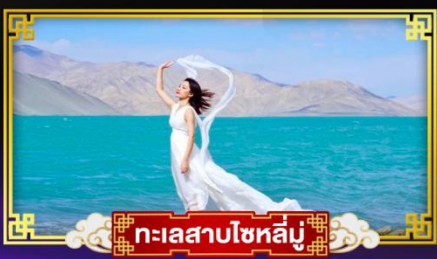
ทะเลสาบไซหล่มู