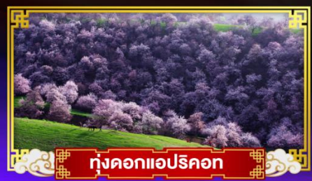
ทุ่งดอกแอปเปิ้ล