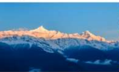
ภูเขาคิมะเหมยลี่