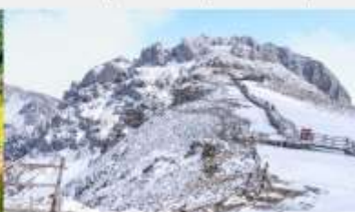
กุเขาคิมะสื่อซ่า