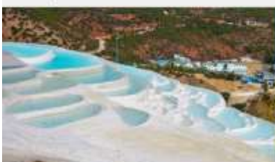
ระเบียงธารน้ำขาว "ไป๋สุ่ยโต"