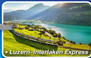
• Luzern-Interlaken Express