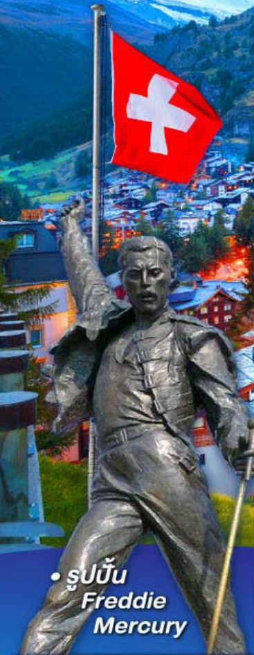
• รูปปั้น Freddie Mercury

พีชิต 5 เวกริก, เวกฮาร์เดอร์คุม, เวกจุงเฟรา เวกลาเซียร์ 3000 และ เวกรอนเนียร์แกรต