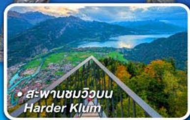
• สะพานชมวิวนบน Harder Klum