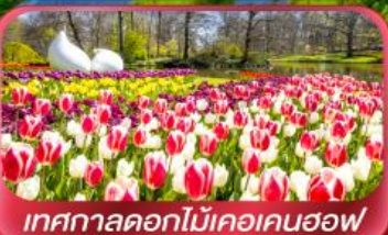
เทศกาลดอกไม้เคอเคนฮอฟ