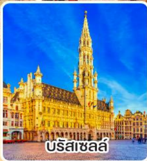
บรัสเซลส์