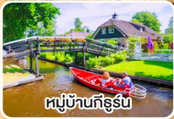
หมู่บ้านทึร์น