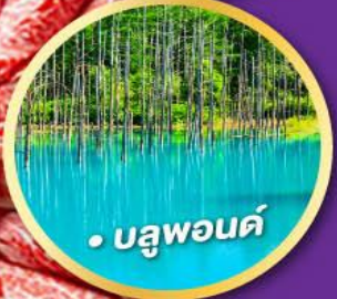
• บลูพอนด์

พักชิปปังโระ 2 คืน พักออนเซ็น 2 คืน 03-09, 10-16 ก.ค. 68 17-23, 24-30 ก.ค. 68