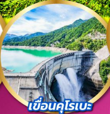
เขื่อนคุโรเบะ