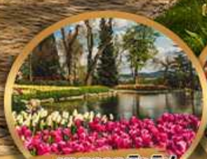
เทศกาลทิวลิป Emirgan Park

28 มี.ค. - 04 เม.ย. / 09 - 16 เม.ย. / 12 - 19 เม.ย.