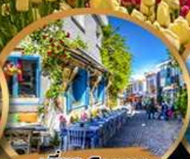
เที่ยว Cesme Alacati