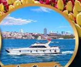
ล่องเรือออร์ซ ชุมชนแคนบอลพอร์