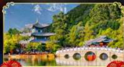
สระมิงกรค่า