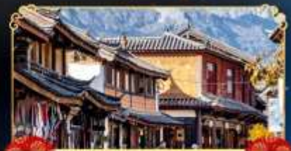
เมืองโบราณปี้ซา