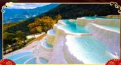
โป๋ส่วยโต

นั่งกระเช้าขึ้นหุบเขาพระจันทร์สีน้ำเงิน ชมวิว "นาพาไห่" ทะเลสาบทุ่งหญ้าที่ดีที่สุด