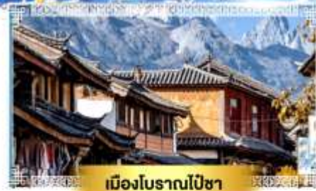
เมืองโบราณไป๋ซา