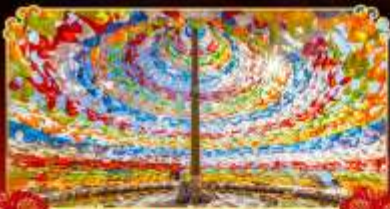
รมนต้อธิฐาน