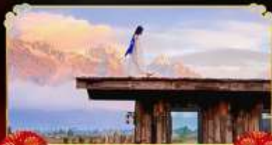
YUN TI YANG CAFE