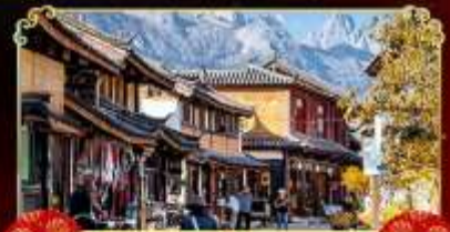
เมืองท่าไปซา