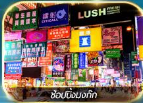
ช้อปปิ้งมงก๊ก

เต็มอิ่มทั้งบุญ และ ช้อปปิ้งแบบจัดเต็ม จิมซาจุ้ย มงก๊ก