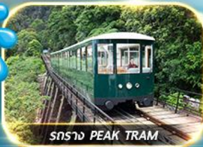
รถไฟฟ้า PEAK TRAM