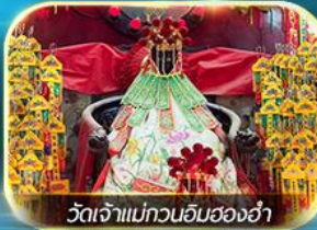
วัดเจ้าแม่กวนอิมสองซ่า