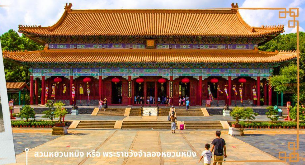
สวนหยวนหมิง หรือ พระราชวังจำลองหยวนหมิง