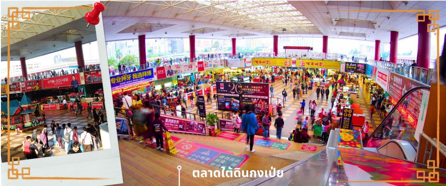
ตลาดใต้ถนนกมเป๋ย