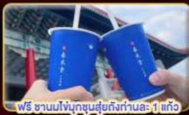
ฟรี ชานมไข่มุกชงสดถึงท่าคณะ 1 แก้ว

เที่ยวใจ เช็किनจุดไฮไลท์ บินบ่าย-กลับดึก